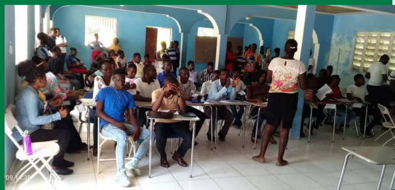
Enseignants en formation

En partenariat avec l'ONG Inter Aide, 3 sessions de formation d'une durée de 5 jours chacune ont eu lieu durant les vacances scolaires de juillet et août 2024 pour les enseignants du 1er et 2e cycle. Elles portaient sur l'enseignement des mathématiques , les sciences expérimentales et l' éducation à la citoyenneté . Ces sessions ont permis aux enseignants de renforcer leurs compétences et la qualité de leur enseignement.