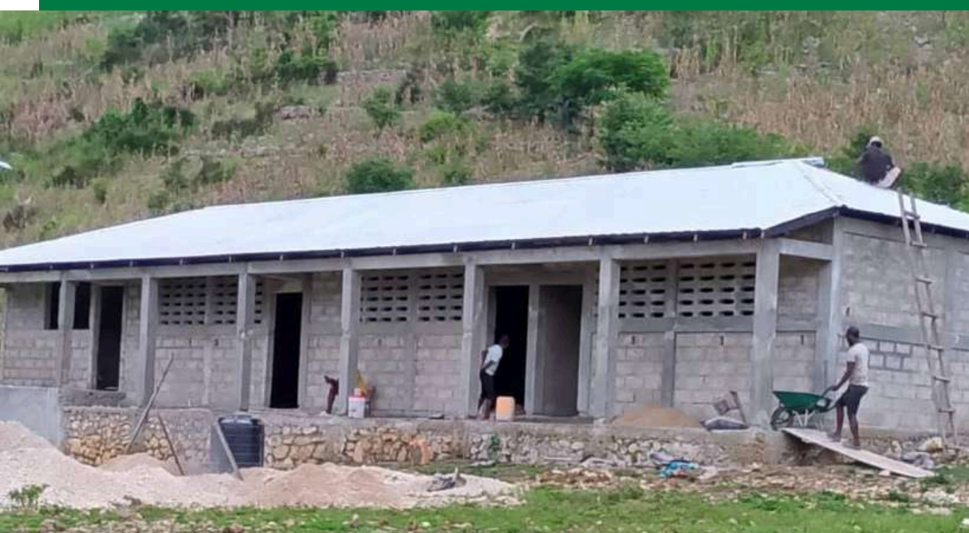
Nouvelles salles de l'école Batrville

Les infrastructures des écoles Damier et Batrville étaient dans un état avancé de détérioration. Ainsi, ce sont 3 salles de classe supplémentaires qui ont été construites dans chacune des 2 écoles afin d'améliorer la qualité de l'éducation dans la zone. Grâce à ce projet, 453 élèves de Benoît Batrville et 238 élèves de Damier peuvent maintenant travailler dans des conditions plus sûres et optimales. L'école Batrville a également bénéficié de la construction d'une nouvelle citerne .