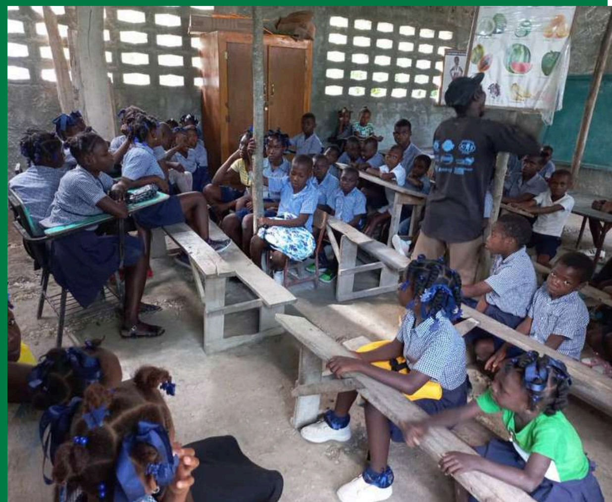
Elèves de l'école Damier (septembre 2024)

En Haïti, la charge financière très importante liée à l'éducation décourage parfois certaines familles, empêchant ainsi la scolarisation de nombreux enfants de la zone. C'est pourquoi UEPLM a souhaité équiper chaque enfant parrainé d'un kit scolaire lors de la rentrée 2024-2025. Chaque kit est composé de cahiers, crayons, taille-crayons, gommes, boîtes d'instruments de géométrie et sacs à dos adaptés à l'âge de l'enfant. Malheureusement, en raison de l'instabilité du pays, les kits achetés à Port-au-Prince n'ont pour l'instant pas pu être acheminés sur la route qui mène à Verrettes et jusqu'aux écoles. Les équipes d'UEPLM mettent actuellement tout en œuvre pour pouvoir réaliser ces distributions dès que la situation sécuritaire le permettra.