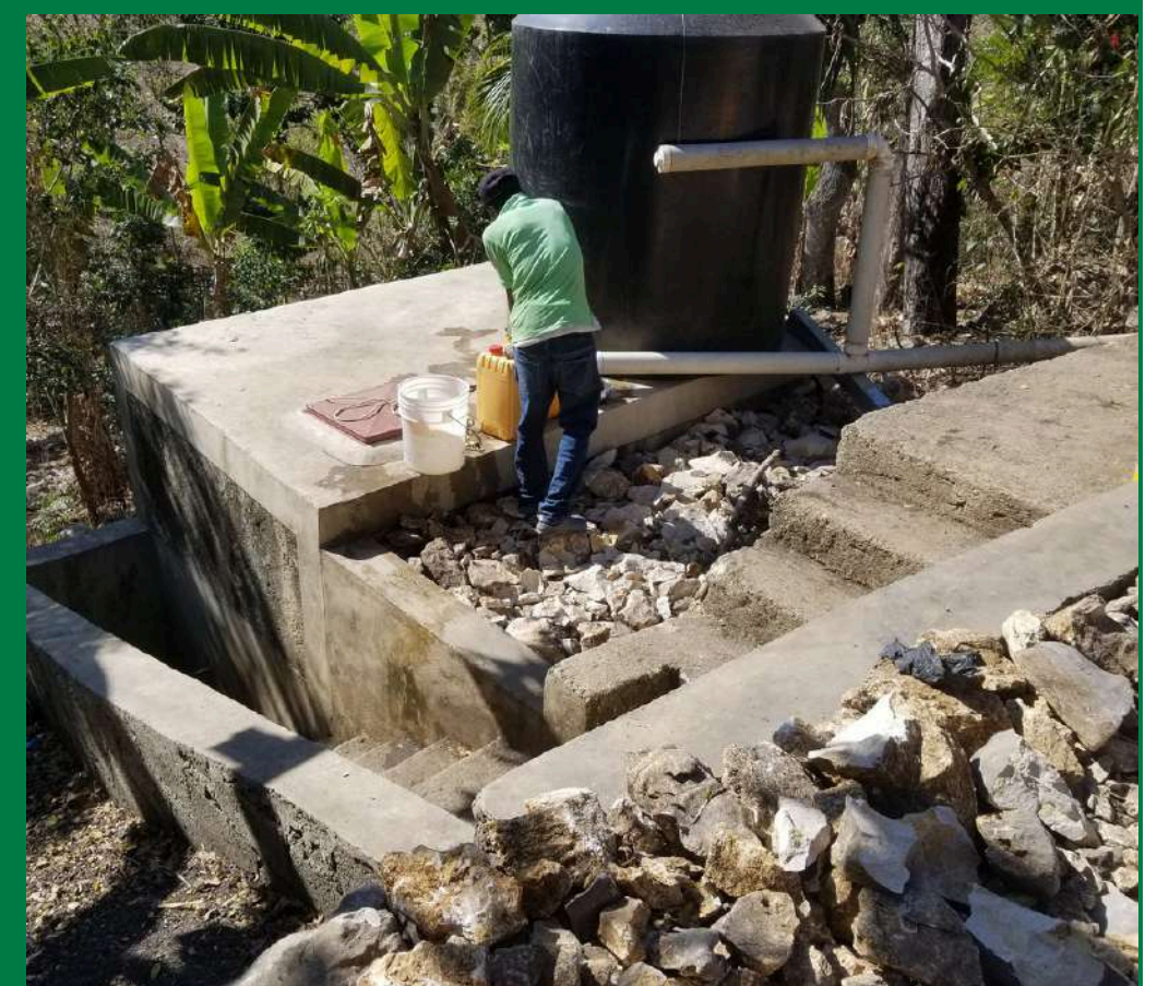
Citerne familiale construite en 2020

Depuis 10 ans, UEPLM a construit 43 citernes familiales, 8 citernes communautaires et 16 bassins sur la Chaîne des Matheux. En 2024, UEPLM a souhaité réaliser un état des lieux de ces ouvrages. Il en ressort que 8 citernes et 3 bassins doivent recevoir quelques petites réparations pour garantir aux populations locales un approvisionnement en eau fiable. Ces petits travaux concernent principalement les éléments de distribution de l'eau (gouttières, robinet, etc.) qui sont les pièces les plus fragiles. Aucune réparation n'est à relever sur les citernes en blocs. Une analyse sera réalisée par notre équipe pour sélectionner des matériaux durables particulièrement résistants aux intempéries.