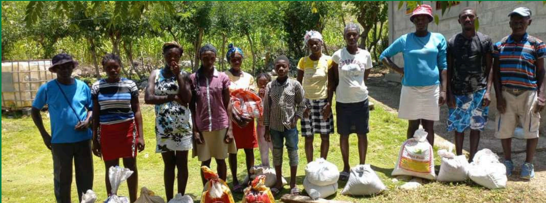
Bénéficiaires des distributions

En juillet 2024, notre relai local a distribué des semences de haricots noirs et haricots beurre à 300 bénéficiaires. Ces légumineuses, essentielles durant la dernière campagne agricole de l'année appelée "Pwa dènye tan" ("haricots de dernière saison"), sont cultivées par de nombreux agriculteurs locaux. Elles offrent aux familles haïtiennes une source de nutrition stable et renforcent leur résilience économique en leur permettant de développer des activités génératrices de revenus (vente d'une partie de la production sur les marchés).