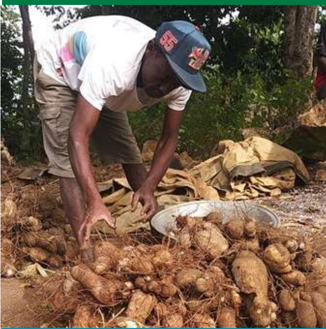
Réception de tubercules d'ignames

Afin de renforcer les capacités d'adaptation des agriculteurs aux effets du changement climatique et améliorer leurs revenus de manière durable, UEPLM s'est associé à ITECA pour les accompagner vers des pratiques agricoles durables et viables, en lien avec l'agroforesterie. Ainsi, 54 bénéficiaires ont reçu des plantules d'arbres fruitiers pour la mise en place de jardins agroforestiers et ont été sensibilisés aux techniques de l'agroforesterie . De plus, 32 agriculteurs ont été identifiés pour bénéficier d'un appui à la mise en place de jardins maraîchers. Ces activités seront poursuivies en 2025.