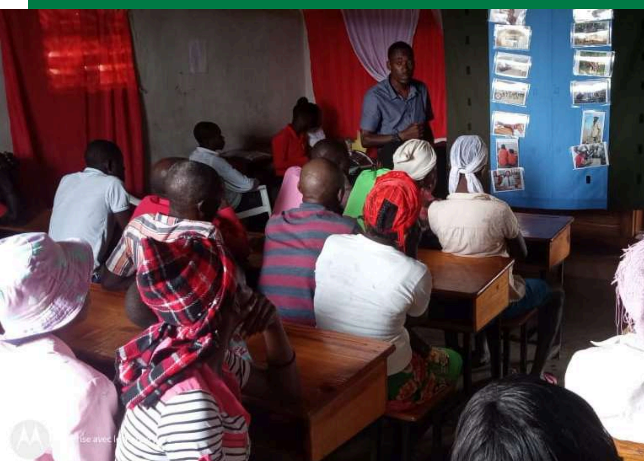
Réunion avec les parents d'élèves

Plus de 15 rencontres ont été organisées avec les parents d'élèves des 5 écoles partenaires. 1337 parents se sont mobilisés pour y participer. Ces rencontres ont été l'occasion pour les équipes d'UEPLM et d'Inter Aide d'aborder des sujets tels que l' importance du préscolaire (équivalent de la maternelle), le matériel des élèves, le paiement des écolages , ou encore le respect du calendrier scolaire . Ces séances seront poursuivies jusqu'à la fin de l'année scolaire 2024-2025.